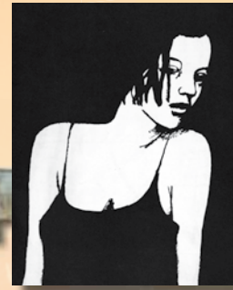
Planche d'Edmond Baudoin

Éditions du Fournel - Tél. 04 92 23 15 75